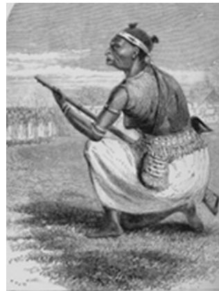
Une Amazone du Roi du Dahomey. Je me demande si vous l'imaginiez ainsi?

Burton dénombre 2500 Amazones mais note qu'elles n'ont rien à voir avec les Amazones de l'Antiquité. Les Coutumes sont des cérémonies religieuses pendant lesquelles on met à mort les prisonniers de guerre et les criminels. Aux seules Coutumes annuelles on immole chaque année 500 victimes auxquelles on confie des