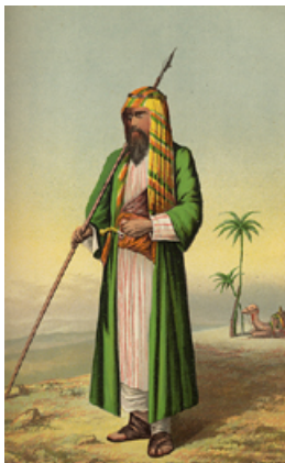
Pèlerinage à La Mecque: Burton déguisé en Mirza Abdullah

De là il va entreprendre à nouveau plusieurs expéditions: une au Gabon pour étudier nos cousins les Gorilles dont on ne sait pas grand'chose à l'époque, une autre chez les Fang célèbres pour leur cannibalisme et deux autres chez le plus sanguinaire de tous les souverains de l'Afrique, le Roi du Dahomey (voir n° 1561-62 A Mission to Gelele, King of Dahome, with notices of the so-called Amazons, the Grand Customs, the Yearly Customs, the human sacrifices, the present state of the slave trade, and the negro's place in nature, by Captain Sir Richard F. Burton, edited by his wife Isabel Burton, memorial Edition, Tylston and Edwards, Londres, 1893 ).