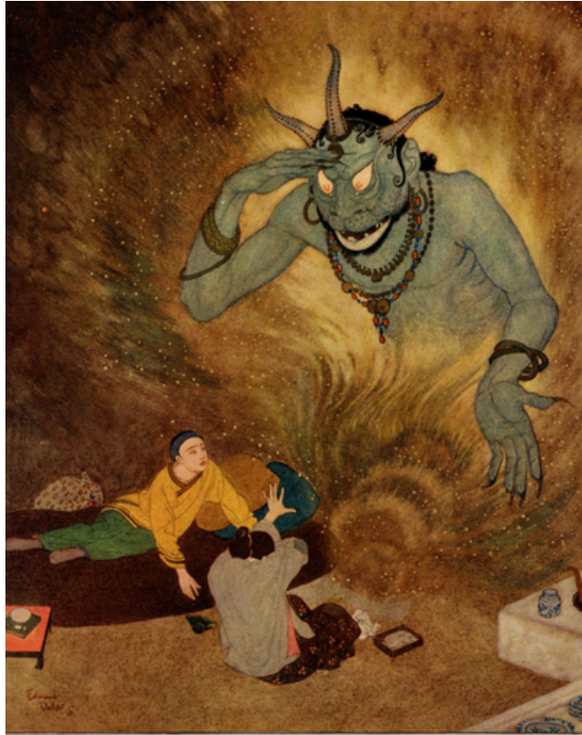
Edmund Dulac: Le Génie de la Lampe

Aladin est un véritable conte de fées, avec la magie de ses génies de l'Anneau et de la Lampe. André Miquel le considère comme un roman de formation. Pourquoi pas? Voilà le chenapan des banlieues qui n'a plus son père, n'obéit pas à sa mère, traîne dans la rue, est la proie du premier magicien venu (cela aurait pu être un pédophile!). Et puis dans l'adversité, enfermé dans son caveau, il se libère avec l'aide du génie et de son astuce. Puis une fois qu'il a compris que les jolis fruits en pierre sont des pierres précieuses, il apprend le business avec les commerçants du bazar comme en banlieue il aurait pu l'apprendre avec les dealers de hasch. Son ambition monte. Il envoie sa pauvre mère qui n'y croit guère mais qu'il manipule, quémander la main de la fille du roi (et à sa grande stupeur le roi l'accepte car les rois jaugent la valeur des prétendants à la grandeur de leur fortune). Une fois dans la position de prince-consort il sait se maîtriser et n'utiliser les génies qu'avec modération. Et quand sa femme à la cervelle d'oiseau risque de lui faire tout perdre en donnant la vieille lampe au rétameur et en accueillant le frère du magicien, il montre qu'il a acquis toute sa maturité et agit en conséquence.