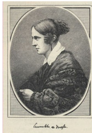
Annette von Droste- Hülshoff

4) n° 0027 Gedichte von Annette Freiherrin von Droste-Hülshoff , édit. Philipp Reclam junior, Leipzig, 1883.