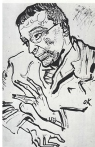
Karl Kraus par Kokoschka

Au cours des années 80 un Allemand est venu démarrer ici à Luxembourg une activité de libraire-antiquaire. Il n'a pas fait long feu. Je crois pourtant avoir été un bon client pour lui. Mais cela n'a probablement pas suffi pour rendre son entreprise rentable. Un jour il me propose de venir avec lui à Brème voir un vieux professeur d'université qui avait mis sa bibliothèque en vente parce que l'état de ses yeux ne lui permettait plus de lire (quel drame ce serait pour moi si cela devait m'arriver un jour!). Nous nous sommes bien vite aperçus que le voyage n'en valait pas la peine: quelques belles reliures (il faisait relier au Portugal) mais de livres récents, beaucoup de publications de l'école de Francfort et de son maître Adorno (mais qui n'intéressaient pas directement mon ami), toute l'oeuvre d'André Gide avec quelques belles éditions de Corydon et les poèmes de Constantin Cavafy (le vieux professeur était visiblement aussi un vieux pédéraste) et puis dans un coin les 12 volumes de la revue Die Fackel de Karl Kraus. Le professeur me regardait d'un oeil suspicieux, se demandant ce que cherchait ce Français chez lui et soupçonnant mon ami de vouloir le rouler ou même de lui voler en douce les plus beaux de ses précieux livres. Finalement je suis reparti avec quelques Heinrich Mann, une belle édition du théâtre de Marivaux très joliment reliée et la collection complète de la Fackel.