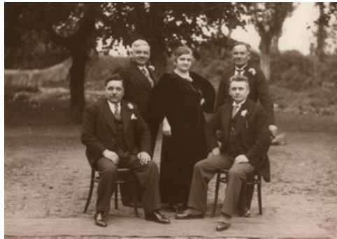
Les cinq survivants de la tribu italo-alsacienne. Mon oncle au premier rang à droite

mes yeux d'enfant, s'embrasser dans la cuisine, après une courte séparation, je sentais bien qu'il se passait quelque chose que je ne comprenais pas bien, une relation mystérieuse qui liait ensemble cet homme et cette femme. C'était comme un feu qui brûlait.